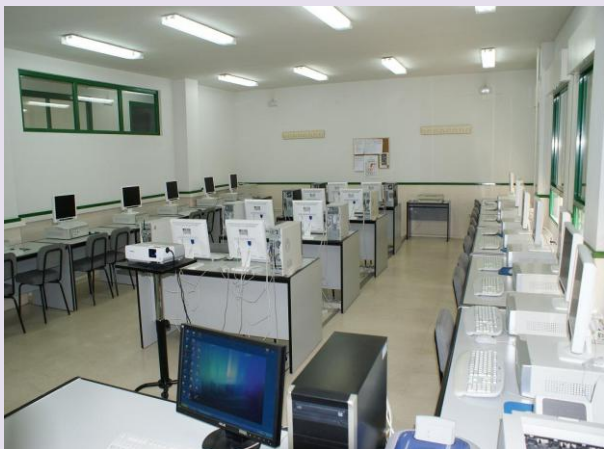
Aula de Aplicaciones Informáticas